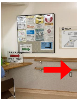
①10階エレベーター降りたら案内に沿って右へ