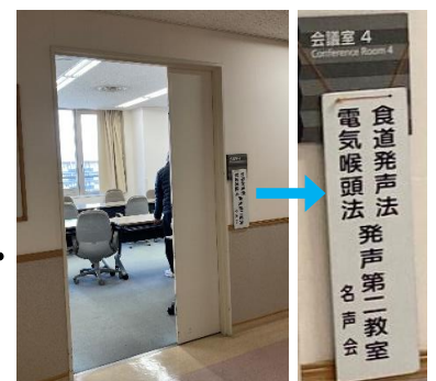
③ 教室入口 (会議室4)